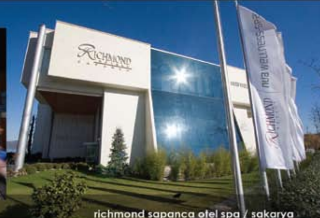
richmond sapanca otel spa / sakarya