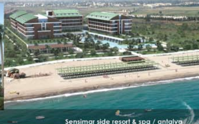
Sensimar side resort & spa / antalya