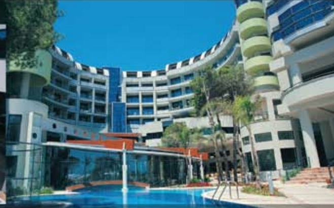
cornelia delux resort otel / antalya