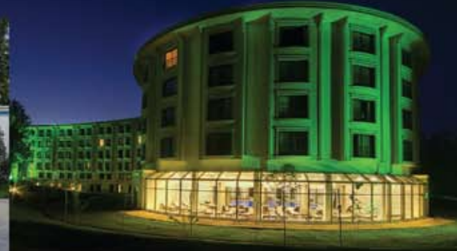
güral sapanca wellness park / sakarya